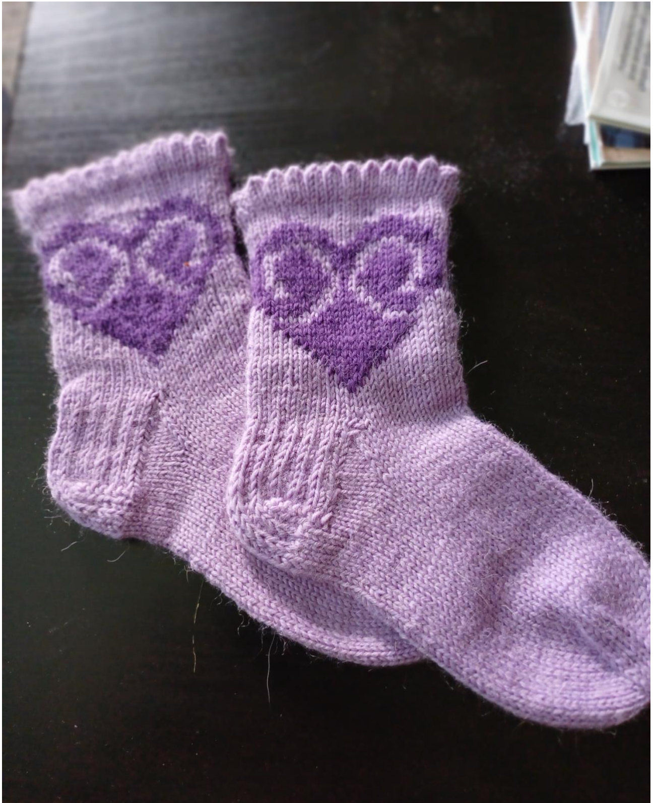
Valmis GySy lilasukka 2024